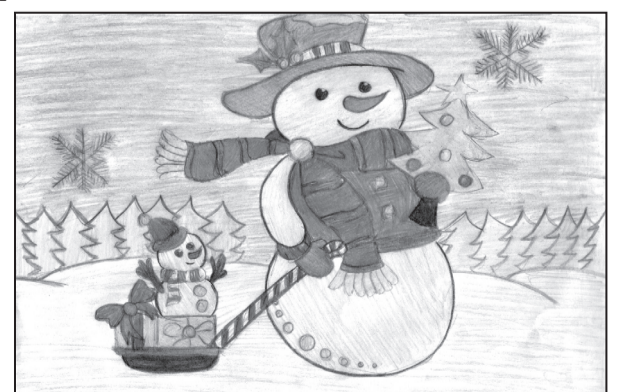
Рис. Глухой Софии, 3 В класс