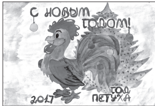
Рис. Меньшикова Владислава, 3 В класс