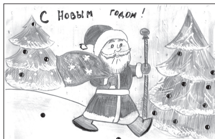
Рис. Тчанниковой Анны, 2 А класс