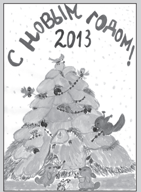
Рисунок Осиповой Яны, 4А класс