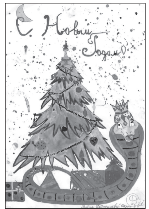
Рисунок Должиковой Дарьи, 4В класс