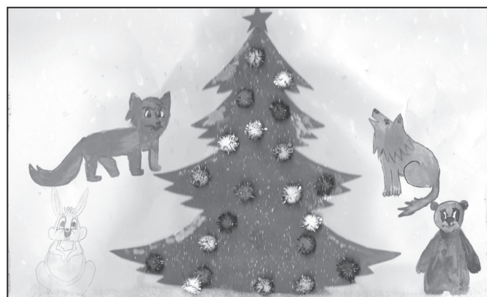
Рисунок Хуранова Рауля, 4А класс