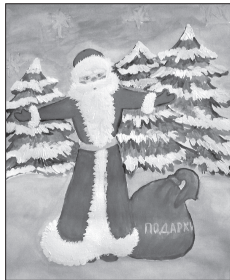
Рисунок Молдован Дарьи, 3А класс