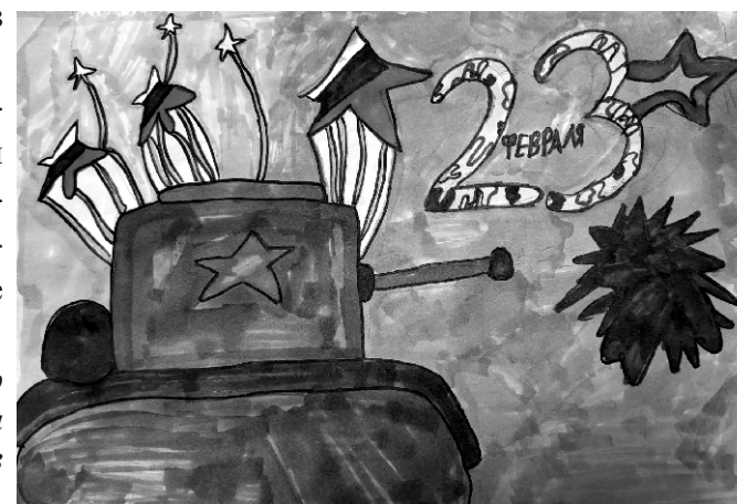
Рис. Чеверда Михелины, 4Г класс