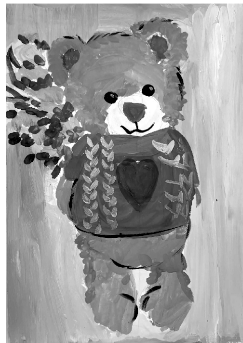
Рис. Шерстобитовой Софии, 2Б класс