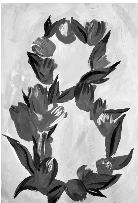
Рис. Елазян Арины, 2А класс