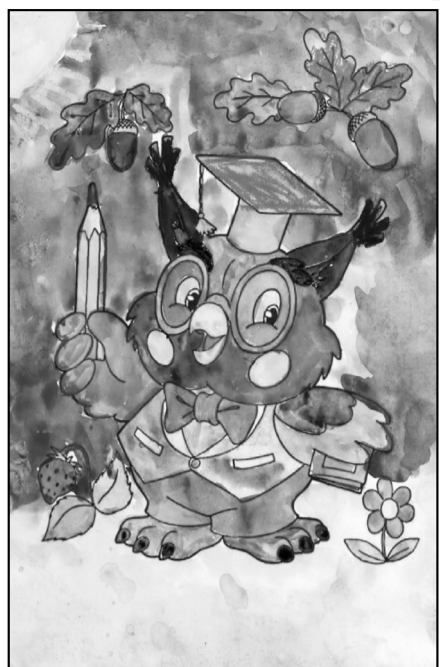
Рис. Андреевой Софии, 2 В класс