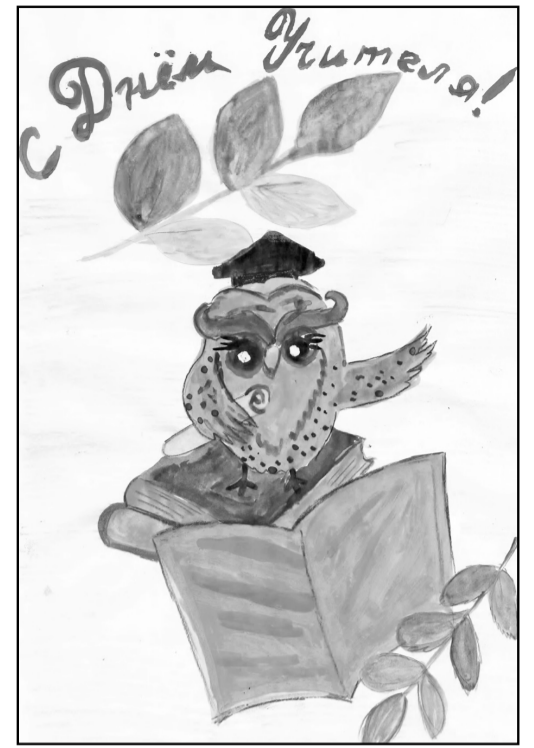
Рис. Сальниковой Ульяны, 4 В класс

Башмакова Евгения, выпускница гимназии, мама ученика 2 А класса